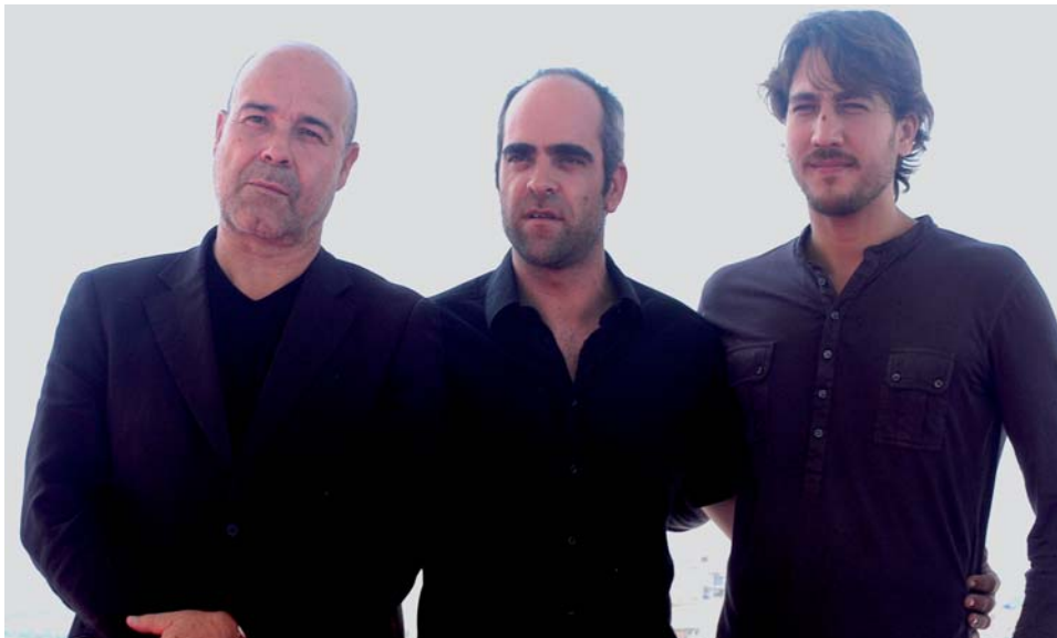
Antonio Resines, Luis Tosar y Daniel Monzón, en su presentación en Sitges.

Luis Tosar inició su singladura artística en la televisión gallega en la serie Mareas Vivas , pero no tardó mucho en llamarle el mundo del cine, donde se ha labrado un gran prestigio. Con su juventud, ya cercano a los 40 años, pocos pueden presumir de haber ganado dos premios Goya por Te doy